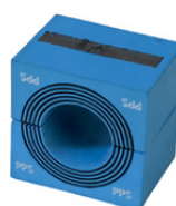
Roxtec CM 40 PPS