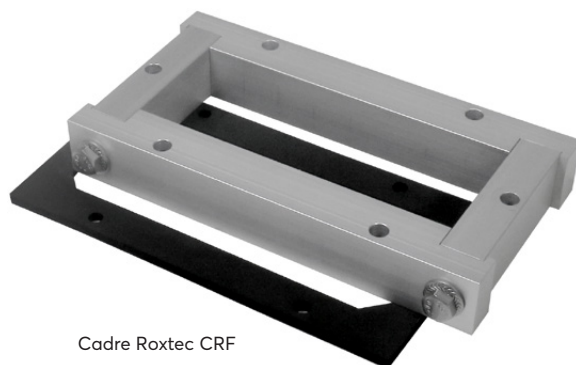
Cadre Roxtec CRF

La conception du cadre, avec ses rails en aluminium, en fait une solution légère, compacte et facile à assembler. Il est ouvrable pour permettre des modifications de conception au niveau des câbles et des conduites.