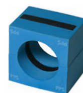
Roxtec CRF 40 PPS