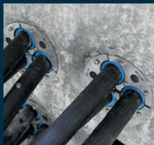
Cables de alimentación de AT