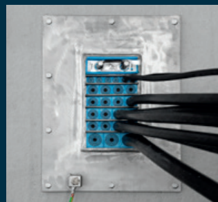
Cables de alimentación MT y BT

Las soluciones de sellado Roxtec son perfectas cuando varios cables o tuberías de diferentes tipos tienen que entrar en cualquier tipo de pared o suelo y la estructura debe cumplir una clasificación de seguridad específica. Mantenga su planta seca y proteja el equipo de la humedad y de los roedores.