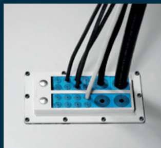
Armarios de control

Los sellos Roxtec, que permiten una gran eficiencia de área, son perfectos para las entradas en armarios con transformadores, envoltentes, cajas de conexiones y otras aplicaciones de armarios que requieren una alta densidad de cables. Proteja su equipo con nuestras entradas inteligentes para cables que se pueden abrir simplificando el mantenimiento y los cambios repentinos.