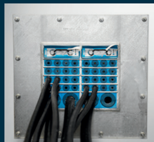
Câbles de contrôle et d'instrumentation