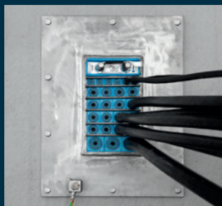
Câbles d'alimentation BT et MT

Les solutions d'étanchéité Roxtec sont idéales lorsque plusieurs types de câbles ou de tuyaux doivent pénétrer un mur ou un plancher quelconque et que la structure doit être conforme à des niveaux de sécurité spécifiques. Maintenez votre site au sec et protégez l'équipement contre l'humidité et les rongeurs.