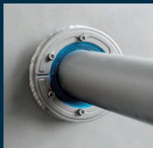
Conduite de gaz