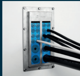
Système de contrôle de distributeur