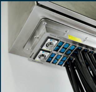
Armoire de commande

Les solutions de passages de câbles Roxtec sont idéales pour les armoires de contrôle de processus, dans n'importe quel endroit. Nos solutions étanches sont testées et approuvées pour vous aider à tout gérer, des différents risques environnementaux au risque d'explosion, dans des atmosphères très exigeantes et potentiellement explosives. Utilisez nos solutions étanches pour répondre aux exigences internationales et locales en matière de sécurité et faire face aux changements rapides ou aux ajouts soudains de câbles de différentes tailles.